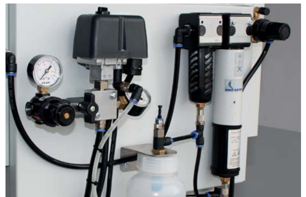
Jun-Air Kompressorsteuerung mit Trockereinheit