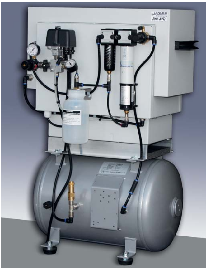
Jun-Air Kompressor OF302-40ST