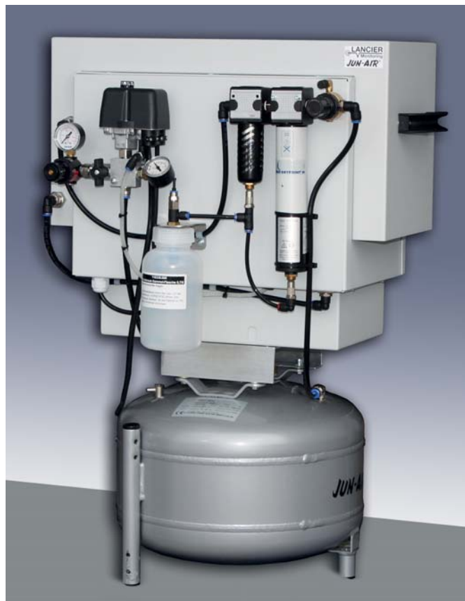
Jun-Air Kompressor OF-87R-25ST