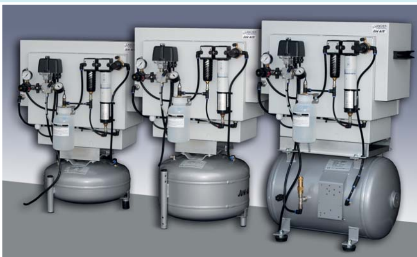
Jun-Air Kompressoren der OF-ST-Serie