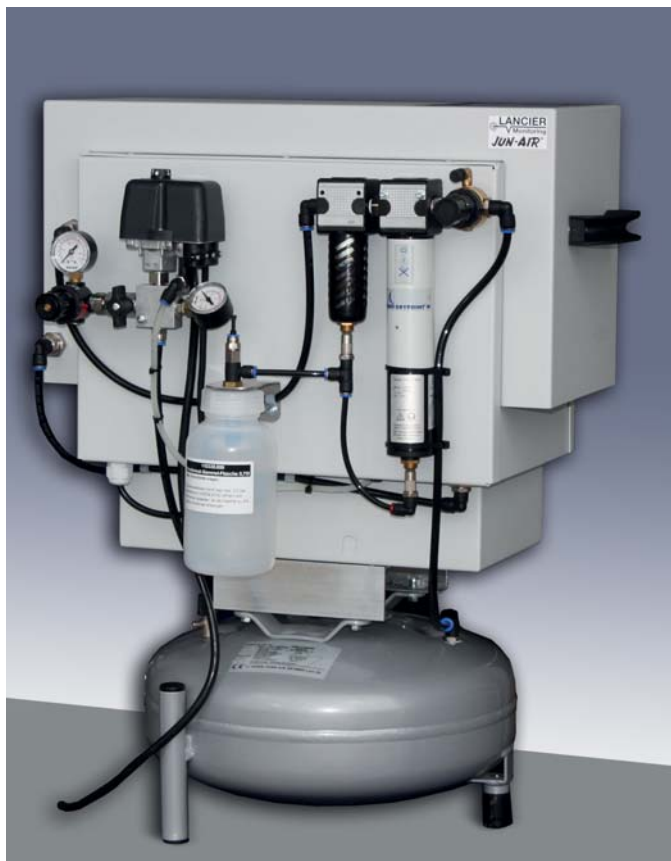
Jun-Air Kompressor OF-86R-15ST