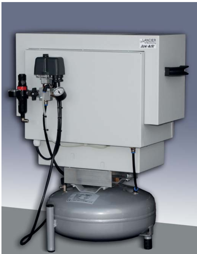
Jun-Air Kompressor OF-86R-15S