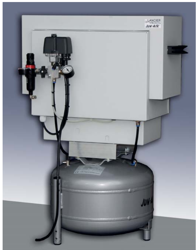
Jun-Air Kompressor OF-87R-25S