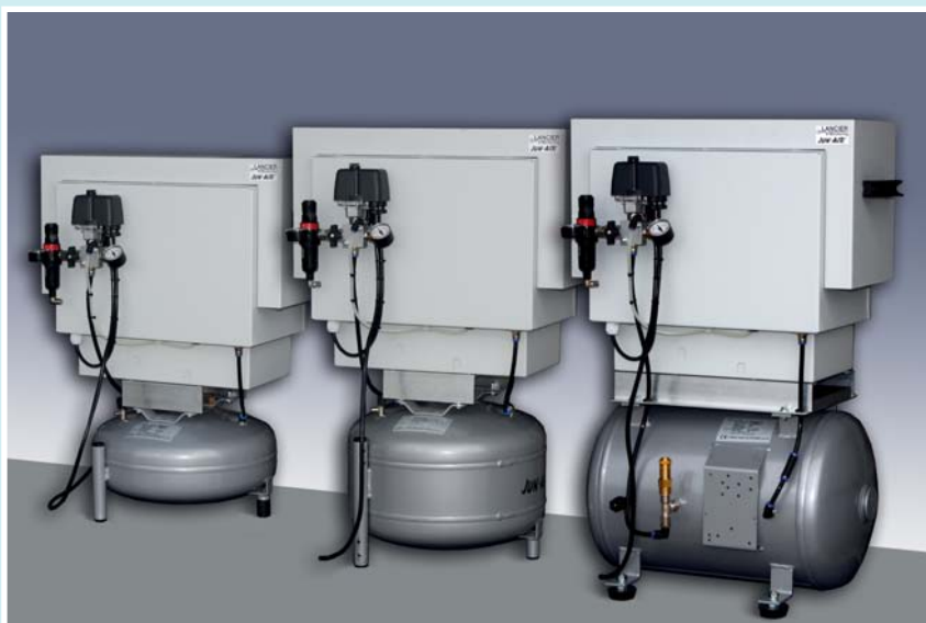
Jun-Air Kompressoren der OF-S-Serie