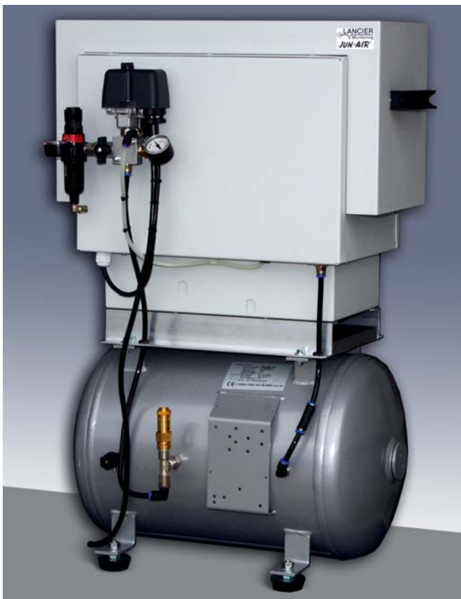
Jun-Air Kompressor OF302-40S