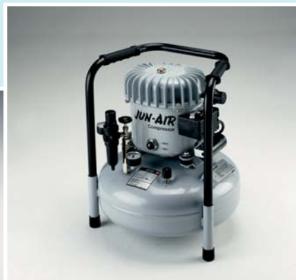
Jun-Air Kompressor 6-15 14-16 bar