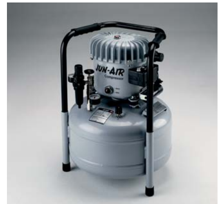
Jun-Air Kompressor 6-25 14-16 bar