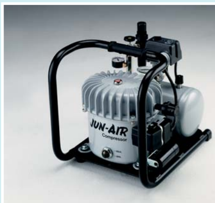
Jun-Air Kompressor 6-4 14-16 bar