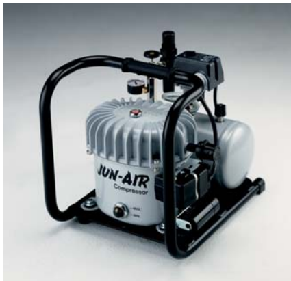
Jun-Air Kompressor 6-4 14-16 bar