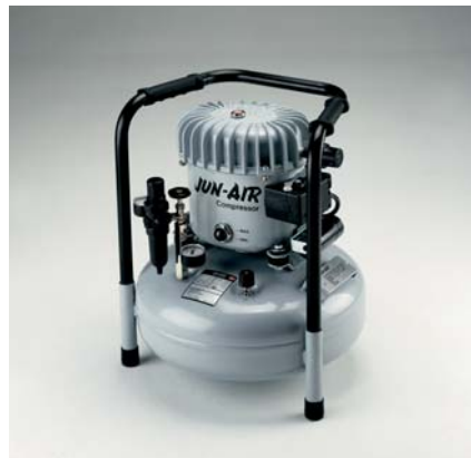
Jun-Air Kompressor 6-15 14-16 bar