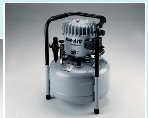
Jun-Air Kompressor 6-25 14-16 bar