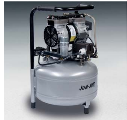
Jun-Air Kompressor 87R-25B

Tankgröße 15 l Gewicht 22 kg Maße (LxBxH) 388 x 380 x 548 mm Bestell-Nr. 1760430