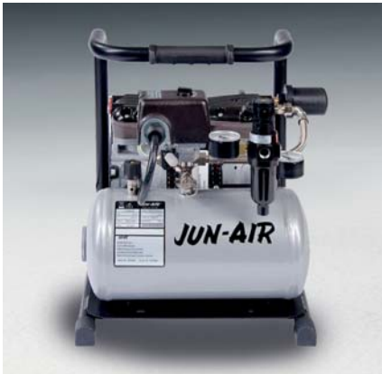
Jun-Air Kompressor 87R-4B

Tankgröße 4 l Gewicht 18 kg Maße (LxBxH) 404 x 306 x 338 mm Bestell-Nr. 1760400