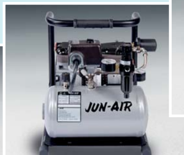
Jun-Air Kompressor 87R-4B