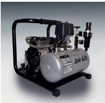
Jun-Air Kompressor 86R-4B

Tankgröße 25 l Gewicht 27 kg Maße (LxBxH) 388 x 380 x 619 mm Bestell-Nr. 1760410