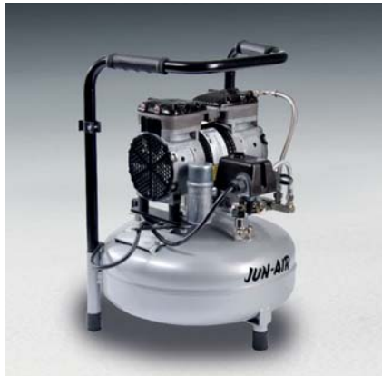
Jun-Air Kompressor 87R-15B

Tankgröße 4 l Gewicht 18 kg Maße (LxBxH) 404 x 306 x 338 mm Bestell-Nr. 1760400