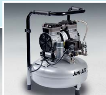
Jun-Air Kompressor 87R-15B