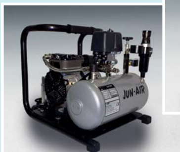
Jun-Air Kompressor 86R-4B