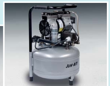
Jun-Air Kompressor 87R-25B