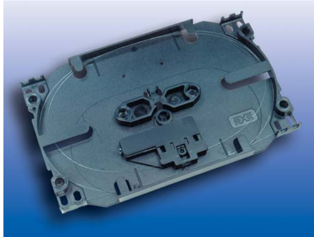
Ek kutusuna monte edilmiş akuva sensör